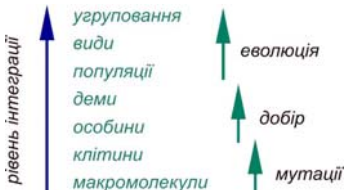
Рис. 2. Вид як учасник еволюційного процесу і відповідність рівнів біологічної диференціації основним типам еволюційних змін (Hull, 1976, зі змінами (зокрема, у схемі Халла немає угруповань)). На кожному рівні має місце співпраця окремих його елементів на користь свого та наступного рівнів.

12. Вид як сукупність чи індивідуальність. Традиційно вид тлумачать як сукупність (аж до уявлення, що існують лише особини), мінливість складових якої визначає просторово-часову неперервність виду. Спроба визначити вид як історичну сутність (рис. 2) закінчилась формулюванням концепції виду як індивідуальності (Hull, 1976; Eldredge, 1985), що змушує постулювати його просторово-часову дискретність.