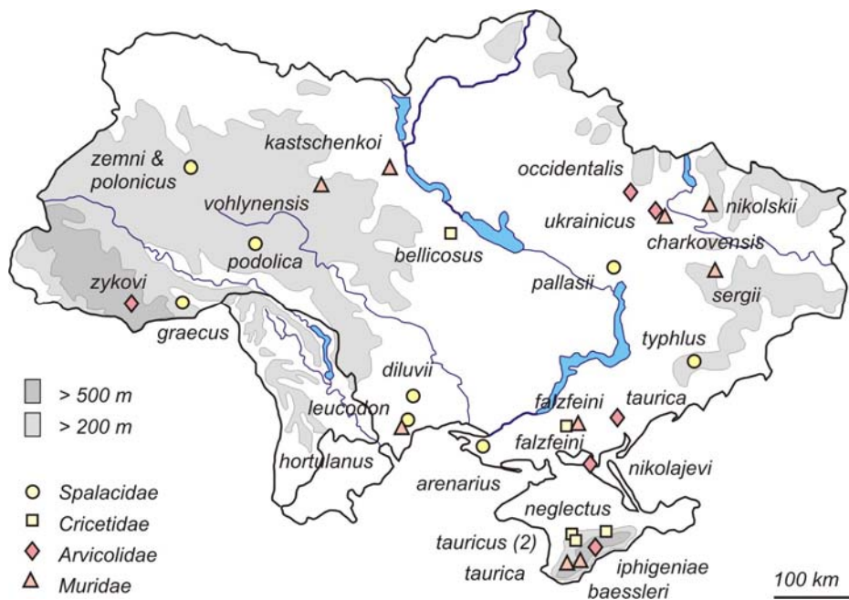
Рис. 2. Географическое положение типовых местонахождений Muroidea, описанных с территории Украины 1 .

Приводимые в тексте данные о числе описанных таксонов, наличии типового материала и количестве предложенных и признанных валидными названий для представленных в фауне Украины видов Muroidea сведены в таблице 1. Типовые местонахождения всех приведенных в тексте таксонов представлены на картосхеме (рис. 2).