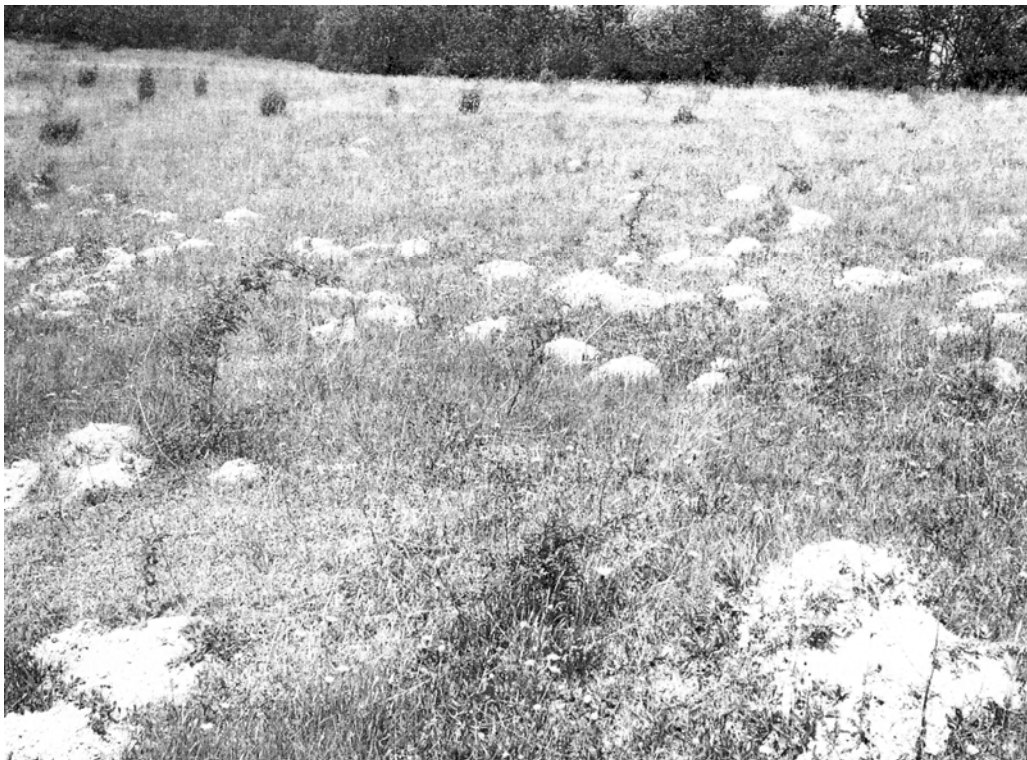
Рис. 2. Викиди крота європейського ( Talpa europaea L.) на пасовищах.