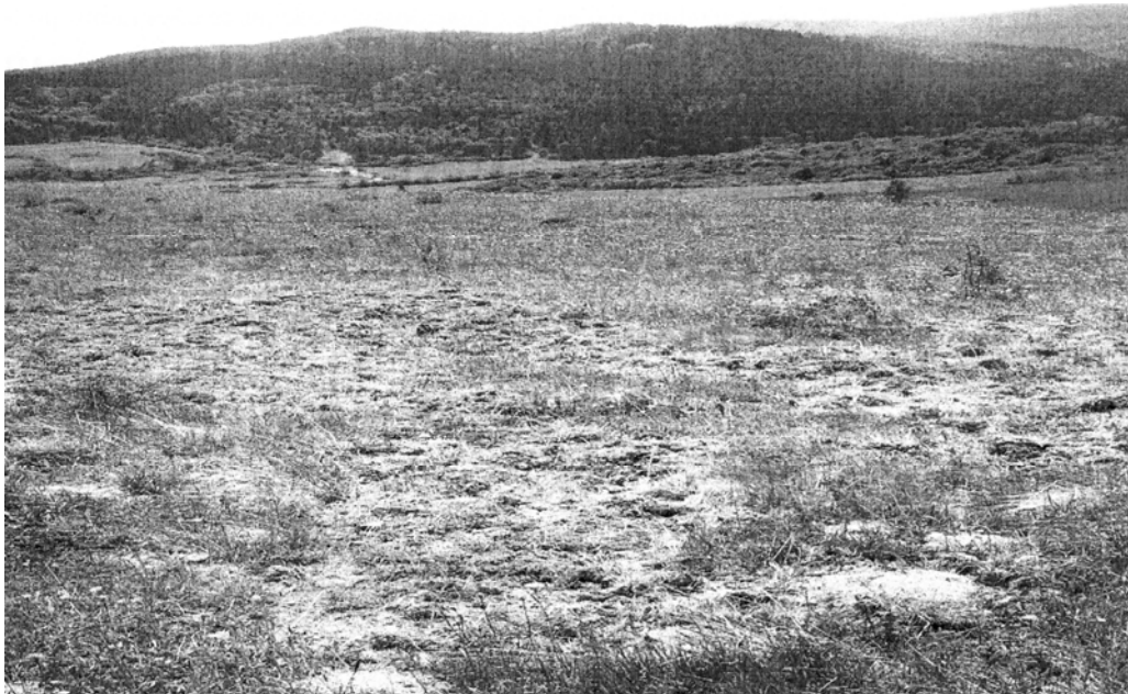
Рис. 1. Порої кабана дикого ( Sus scrofa L.) на пасовищах (серпень 2007) поблизу с. Головецько (Львівська обл.).