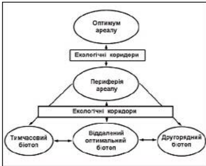
Рис. 1. Схема відновлення межі ареалів і формування маргінальних популяцій.