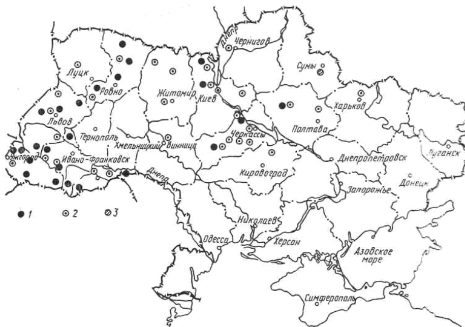
Рис. 1. Распространение полчка ( Glis glis ) на территории УССР: 1 — сведения из музеев, СЭС и собственные сборы; 2 — сведения из литературных источников; 3 — устные сообщения о находках сонь.

Садовая соня ( Eliomys quercinus ). В пределах СССР садовая соня остается наименее изученным видом. Этим, вероятно, объясняется и то, что Г. Н. Лихачев (1972) проводит южную границу ее ареала в европейской части СССР вне территории Украины. О находке этого вида 25.04.1965 г. в Уманском р-не Черкасской обл. Г. Н. Лихачев пишет лишь в сноске своей работы, не делая при этом никаких выводов*. Тем не менее, находки садовой сони в Рокитновском р-не Ровенской обл. в 1965 и 1967 гг., в Вышгородском р-не Киевской обл. (Пуца-Водица под Киевом) 23.07.1976 г. и в Олевском р-не Житомирской обл. в июле 1986 г. существенно меняют сложившееся представление о южной границе ареала данного вида. Исследования, проводимые нами, пока не дали новых подтверждений наличия Eliomys quercinus в Уманском р-не Черкасской обл. Однако последняя находка кормящей самки с выводком в скворечнике на территории центральной усадьбы Полесского заповедника в июле 1986 г. дает нам основание однозначно утверждать, что садовая соня на Украине есть и южная граница ее ареала в пределах СССР проходит не по Белоруссии (Лихачев, 1972), а по Украине (рис. 2).