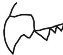
Рис. 1. Форма зубов верхней челюсти

Череп : метрические особенности черепа представлены в таблице 1.