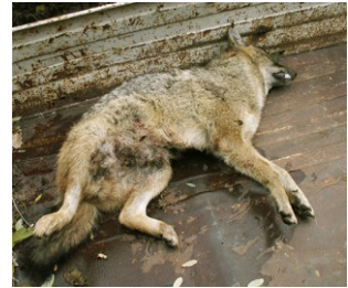
Рис. 5. Шакал, здобутий біля с. Парутине 15.11.2015.

Fig. 4. Jackals shot near Solonchaki on 8.11.2015.