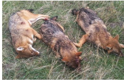
Рис. 4. Шакали, здобуті поблизу с. Солончаки 8.11.2015.

Fig. 3. The jackal shot near Ivanivka on 24.02.2013. Photo by Yu. Patenko.