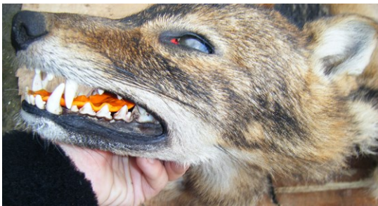
Рис. 1. Голова шакала здобутого біля Тилігульського лиману 22.10.2008 р.

Отримані дані дають підставу говорити про формування осередку розмноження шакалу на материковій частині півдня Миколаївської області в межах Очаківського району. З грудня 2010 р. до грудня 2015 р. там виявлено 43 тварини. Найбільшу зграю, з 9 особин, спостерігали 8.11.2015 р. у пониззях балки Аджигол поблизу с. Солончаки. Зауважимо, що вид знаходиться під значним пресом мисливців, здобуто 34 особини, але чисельність його зростає. В Березанському р-ні виявлено і здобуто лише одну тварину, у 2008 р. Як повідомив нам місцевий таксидерміст, більше фактів здобуття шакалів йому не відомо.