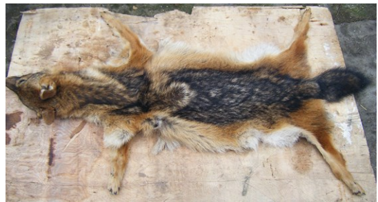
Рис. 2. Шкура шакала, здобутого біля Тилігульського лиману 22.10.2008 р.

Fig. 1. The head of the jackal shot near the Tylihul Estuary on 22.10.2008. Photo by the author.