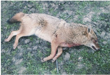
Рис. 3. Шакал, здобутий біля с. Іванівка 24.02.2013.

Fig. 3. The jackal shot near Ivanivka on 24.02.2013.