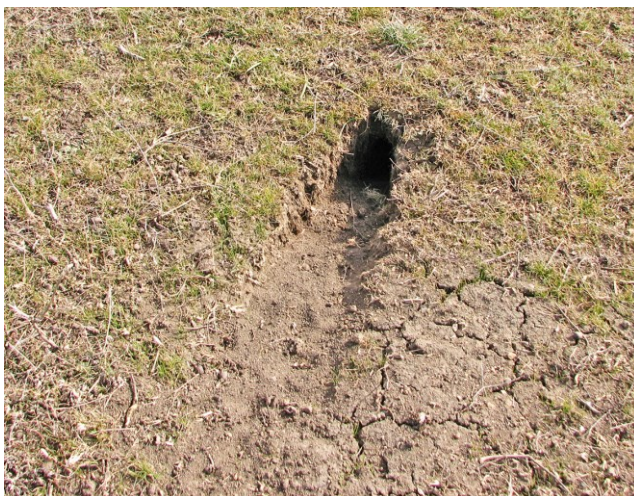
Рис. 1. Нора тушканчика, окр. с. Касьяновка (пункт 13 в табл. 1).

С 2006 по 2014 г. автомобильными и пешими маршрутами была охвачена практически вся территория донецкого Приазовья. Менее обследованной оказалась остальная территория Донецкой обл. В подходящих условиях велся поиск животных или характерных для тушканчика нор. Учитывалось количество нор на полосе шириной 10 м и затем, в зависимости от длины маршрута, рассчитывалась плотность. Для пересчета на количество особей принято, что на одного зверька приходится одна нора (Селюнина, 2008 б). Результаты фиксировались фотоаппаратом (напр. см. рис. 1). При помощи GPS-навигатора места обнаружения животных или нор наносились на карту. Картографическая информация обрабатывалась при помощи свободного программного обеспечения QGIS.