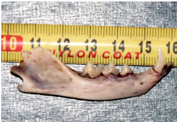
Рис. 2. Нижня права щелепа Felis silvestris , знайденого 10.10.2014 р.