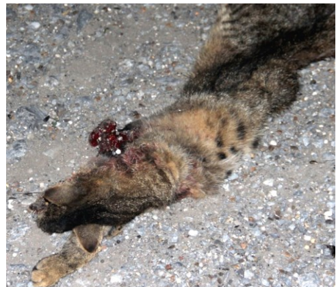
Рис. 3. Фрагмент тіла Felis silvestris , знайденого 10.10.2014 р.