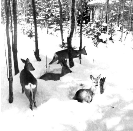
Сарна європейська в ур. Кам'яна (грудень 1969 р., окол. с. Кам'яна, Сторожинецький р-н, Чернівецька обл.).