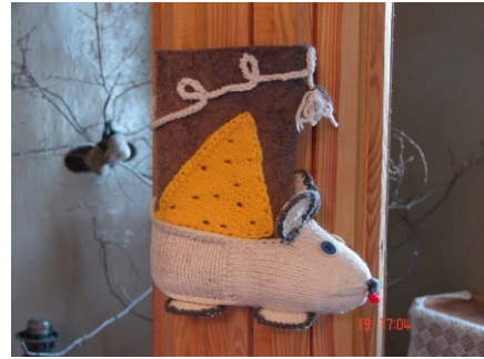
Рис. 3. Експонат з Музею Валянок.

Найнасиченішою виявилася секція «Філогеографія, філогенетика і систематика» (близько 50 доповідей). Багато з цих доповідей було присвячено використанню генетичного методу досліджень для вирішення питань географічного розповсюдження підвидів, гібридних зон, в першу чергу у Mus m. musculus та M. m. domesticus , у роді Microtus . Велику частину доповідей на цій секції склали виступи польських, турецьких і російських колег.