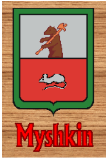
Рис. 1. Герб м. Мишкін.