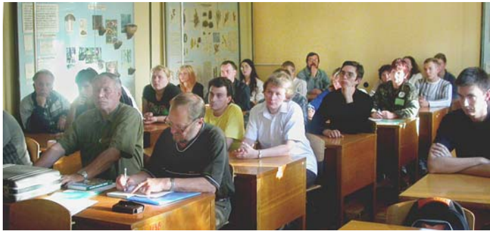
Рис. 2. Вступне засідання 13 конференції «Дослідження та охорона птахів басейну Сіверського Дінця» (Луганськ, 23.09.2005 р.).

На емблемі конференції 2010 р. — лунь степовий (рис. 3). Цей вид ми обрали для емблеми як один з найбільш рідкісних в Україні і такий, що символізує типове для сходу України степову фауну, маючи й назву «степовий».