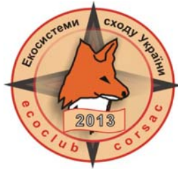
Рис. 5. Логотипи луганських конференцій циклу «Динаміка біорізноманіття»: ліворуч — емблема Першої конференції 2012 р., праворуч — одна з емблем 2013 р., для «молодіжної» частини форуму (сесії першого дня).