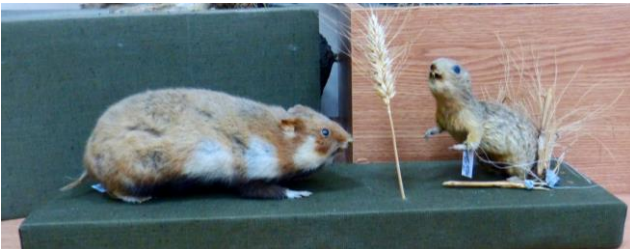
Рис. 1. Хом'як і ховрах з колекції відділу природи Житомирського обласного краєзнавчого музею (2021 р.).

До першоджерел про цей вид на теренах даної території належать праці А. В. Ксенжопольського (1915 a–b ). Відповідно до мапи впорядкованої дослідником у 1913–1914 роках локальне поселення ховрахів було у нинішньому Любарському районі. Крім того, у переліку відомих поселень ховрахів цей автор також зазначав Троянівську волость (нині у складі Житомирського району). Однак він ставив під сумнів їхню наявність в Новоград-Волинському та Житомирському повітах.